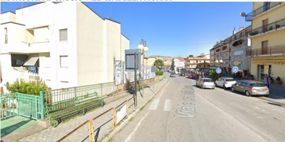
INIZIO V.LE ISABELLA MORRA DA ROTATORIA