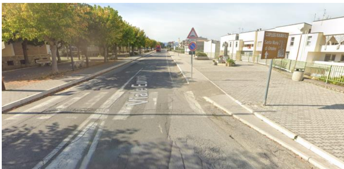
V.LE EUROPA DIREZIONE ROCCANOVA 1° TRATTO