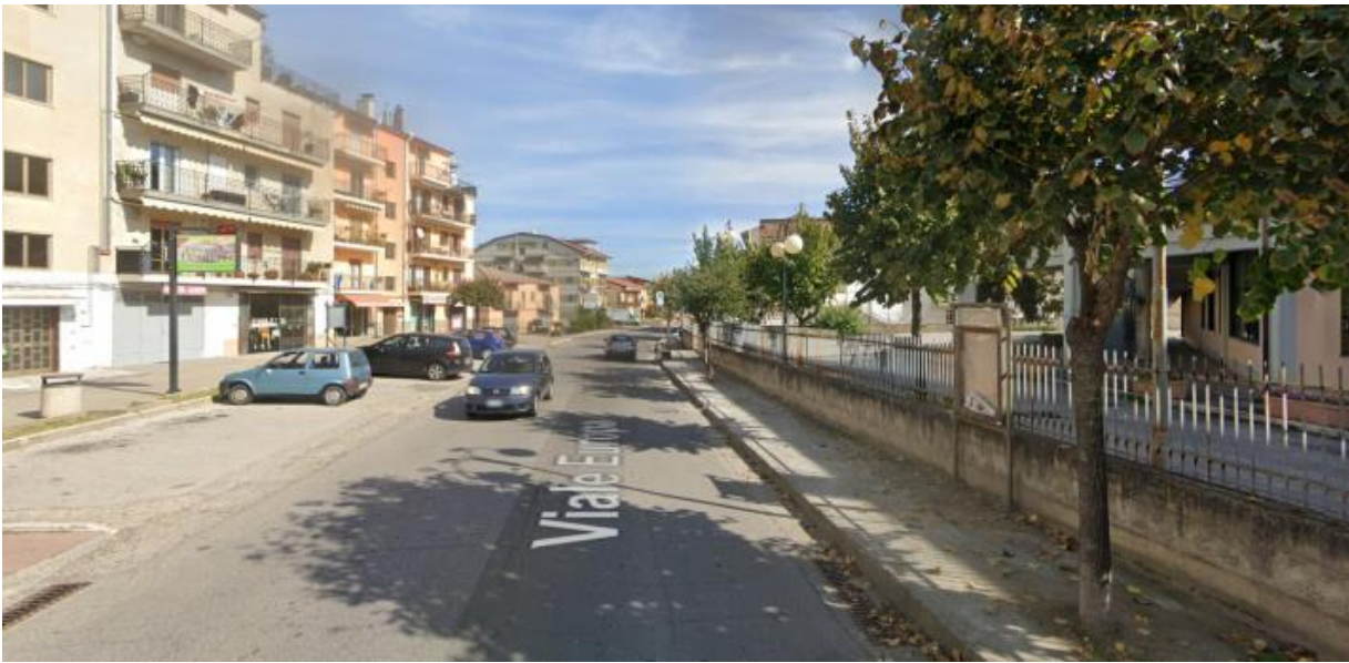
V.LE EUROPA DIREZIONE SANT'ARCANGELO 2° TRATTO