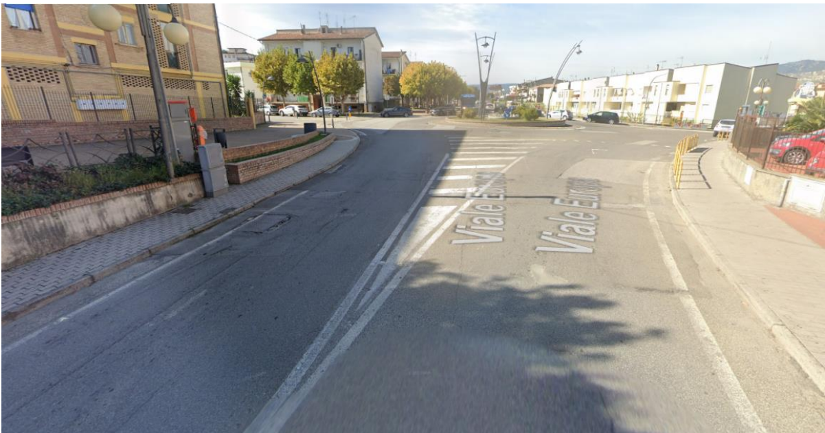
ROTATORIA INCROCIO V.LE ISABELLA MORRA