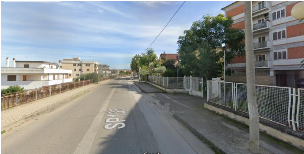
V.LE EUROPA DIREZIONE ROCCANOVA 2° TRATTO