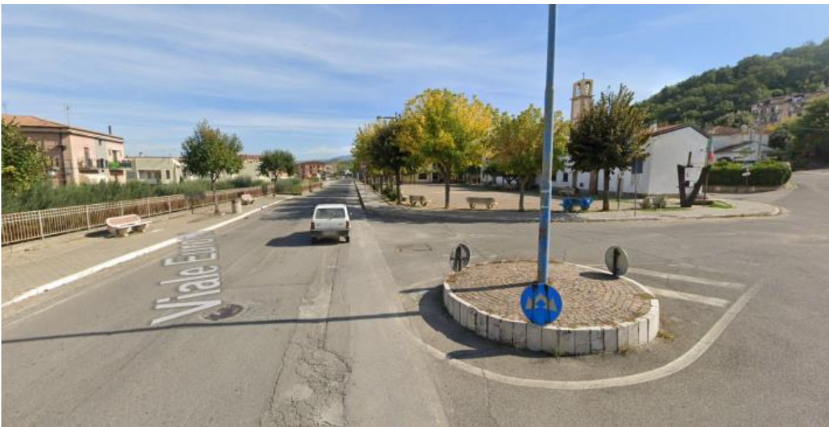
ROTATORIA V.LE EUROPA