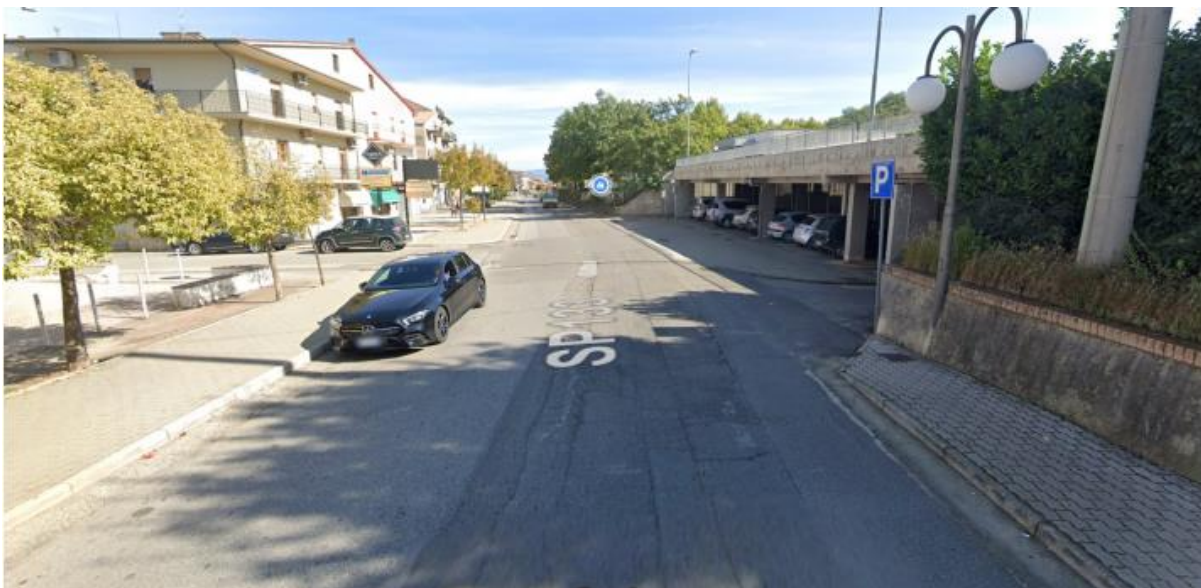
V.LE EUROPA DIREZIONE SANT'ARCAANGELO 1° TRATTO