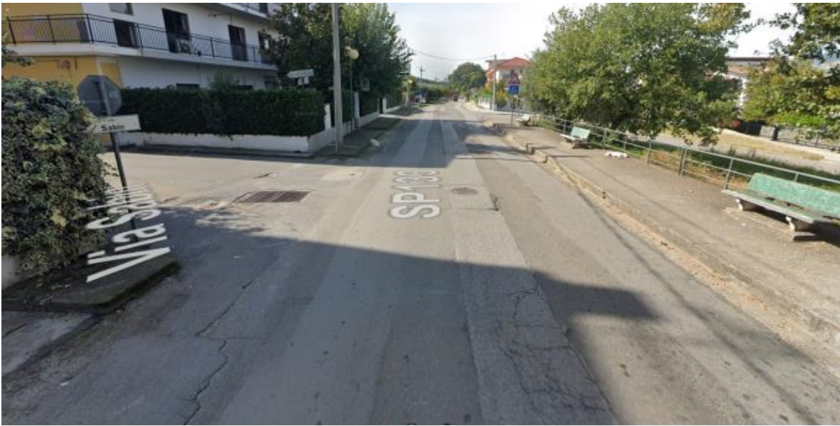
V.LE EUROPA DIREZIONE ROCCANOVA 3° TRATTO