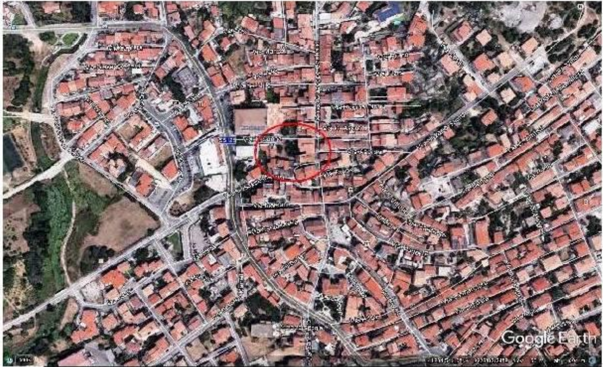
ALLEGATO - 002 - VISTA SATELLITARE PANORAMICA